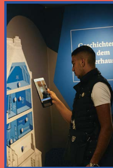
Ein digitales Tool erlaubt es, das Lernlabor selbstständig zu erkunden.