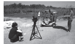
Dreharbeiten zum Film „Erhobenen Hauptes...“