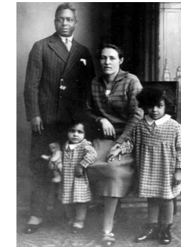
Hagar Martin Brown

einhergehenden Selbst- und Fremdbildern auseinander. Zugleich werden sie für koloniale Kontinuitäten sensibilisiert. Noch heute verwenden wir in unserem Alltag rassistische Begriffe. Darüber hinaus sind diskriminierende Denkweisen und (Welt)Bilder präsent, die während des Kolonialismus entstanden.