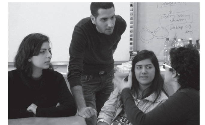
Im Gespräch: TeilnehmerInnen des Austauschprojektes

im Jahr 2011. In dieser Zeit fand ein intensiver gemeinsamer Lernprozess von Lehrern aus Frankfurt und Nazareth in einer Reihe von Fortbildungen statt. Im Mittelpunkt stand die Frage, wie kann eine schulische Umgebung gestaltet werden, die gleichberechtigte Bildungschancen ermöglicht, Menschenrechte respektiert und aktiv fördert. Das Projekt wurde wissenschaftlich von einem trinationalen Expertenteam begleitet. Die Ergebnisse werden abschließend in einem Praxishandbuch veröffentlicht.